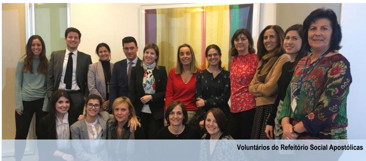
Voluntários do Refeitório Social Apostólicas

Durante 2019, participaram neste programa vinte e um voluntários .