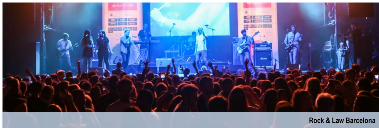
Rock & Law Barcelona

A iniciativa foi promovida pelas fundações Professor Uría, Clifford Chance, Cuatrecasas, Fernando Pombo, e Garrigues. Na organização do evento também participaram CMS, Roca Junyent e um grupo de abogados del Estado .