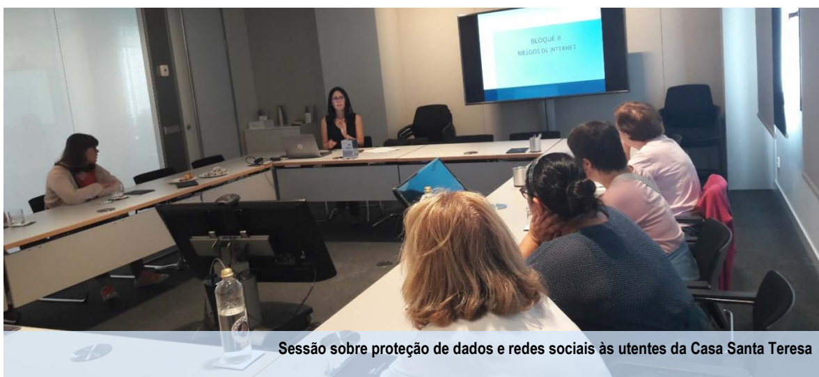
Sessão sobre proteção de dados e redes sociais às utentes da Casa Santa Teresa