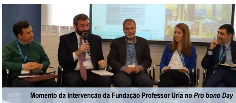
Momento da intervenção da Fundação Professor Uría no Pro bono Day

Em 6 de novembro de 2019, a Fundação Professor Uría participou no Pro Bono Day , organizado em Madrid, pela Fundación Pro Bono España, TrustLaw, PILnet e DLA Piper, com o objetivo de impulsionar a cultura pro bono em Espanha