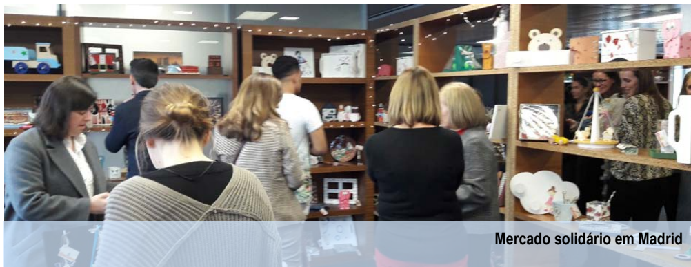
Mercado solidário em Madrid