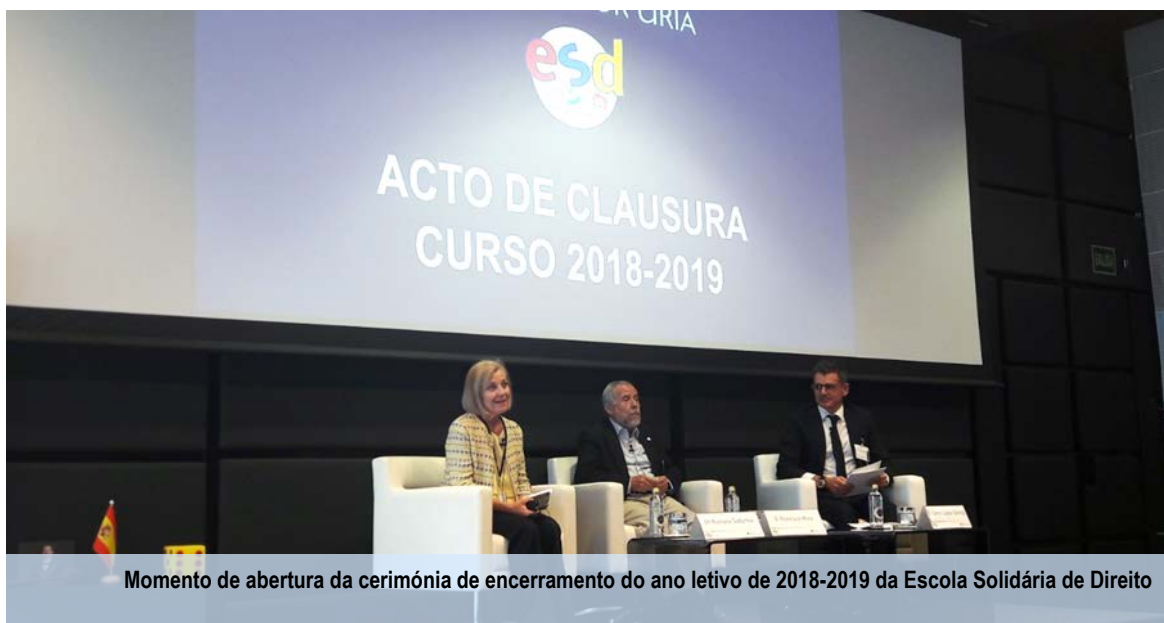
Momento de abertura da cerimónia de encerramento do ano letivo de 2018-2019 da Escola Solidária de Direito

O evento, que teve lugar no auditório da Uría Menéndez de Madrid, reuniu diretores, coordenadores e professores de muitas das escolas nas quais se lecionou o programa durante este ano letivo, assim como voluntários e simpatizantes do programa.