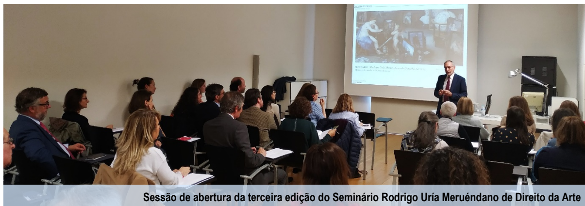
Sessão de abertura da terceira edição do Seminário Rodrigo Uría Meruéndano de Direito da Arte