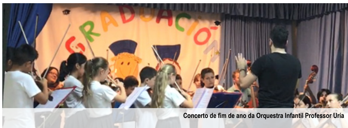
Concerto de fim de ano da Orquestra Infantil Professor Uría

A Orquestra Infantil Professor Uría é uma iniciativa sociocultural fruto da colaboração entre a Fundação Professor Uría e a Fundación Acción Social por la Música. Com o encerramento do ano letivo, a orquestra formada pelos alunos do 6.º ano da CEIP La Alameda, de Madrid, ofereceu um concerto aos restantes alunos e aos professores do colégio.