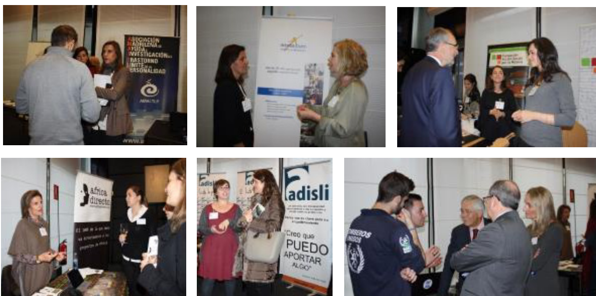
Imagens da Feira da Solidariedade em Madrid

Além disso, no escritório de Madrid, organizou-se a primeira Feira da Solidariedade para dar a conhecer a atividade desenvolvida por algumas das entidades com as quais a Fundação Professor Uría colabora. Nesta primeira edição, as entidades presentes foram a Fundación Soñar Despierto, Bombeiros Unidos sem Fronteiras, Fundación Lescer, Asociación Norte Joven, Fundación África Directo, Fundación Emalaikat, AMAI TLP, ADISLI, Fundación Acción Social por la Música e o Centro de Menores Teresa de Calcuta.