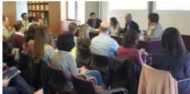
Apresentação do Guía práctica de preguntas frecuentes en la puesta en marcha de un negocio