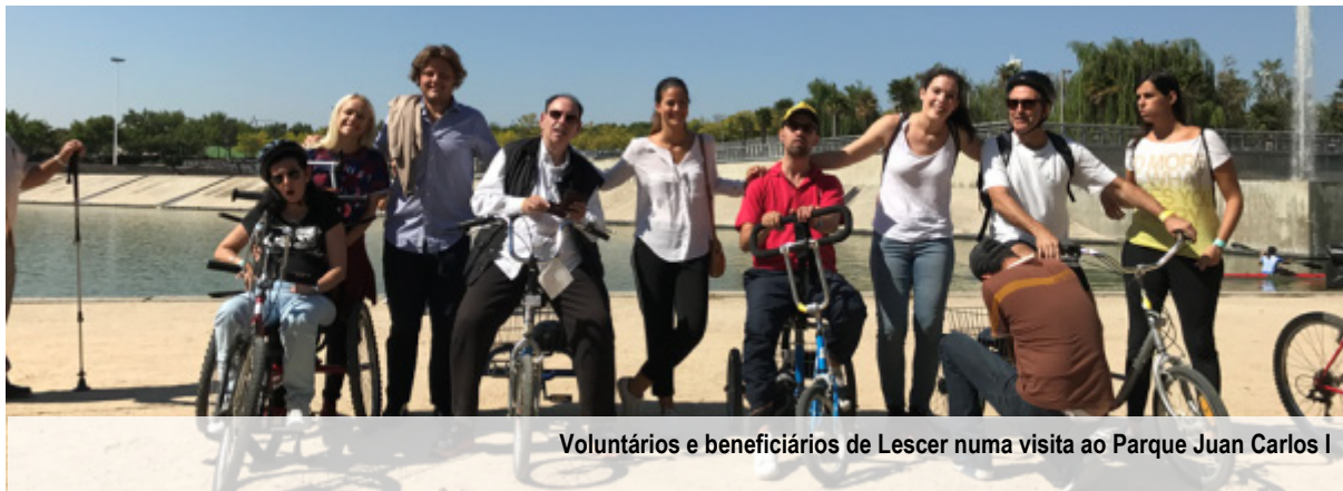
Voluntários e beneficiários de Lescer numa visita ao Parque Juan Carlos I