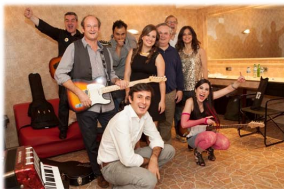
Componentes del grupo “Tipos de Interés”, de Laso & Asociados y Uría Menéndez.

El concierto, celebrado el 12 de julio de 2012 en la sala la Riviera de Madrid, fue presentado por Anne Igartiburu y logró recaudar 49.330 € gracias a las más de 2000 personas que acudieron al evento solidario.