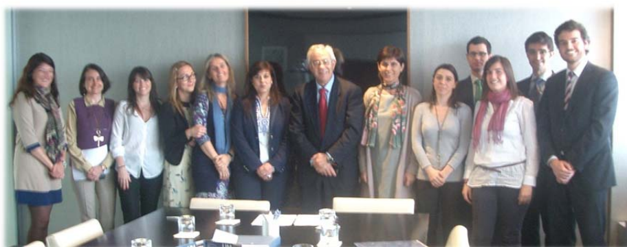
Firma del convenio con la Fundación Lescer (7 de mayo).