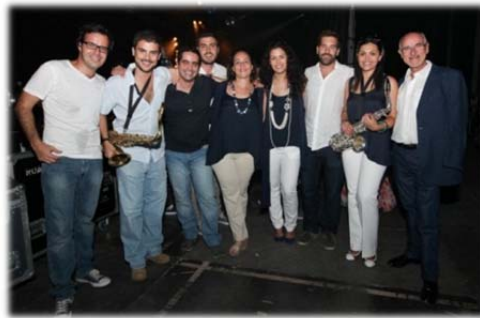
Componentes del grupo “Heróis del Despacho”, de Uría Menéndez Proença de Carvalho.