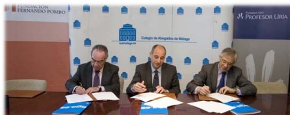
Firma del convenio con el Ilustre Colegio de Abogados de Málaga (25 de enero).