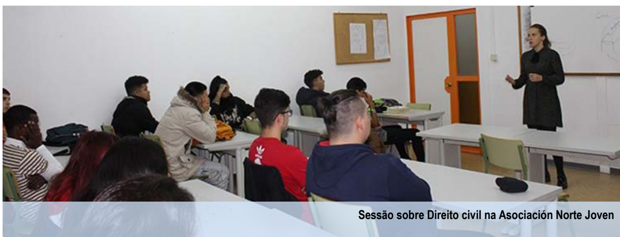
Sessão sobre Direito civil na Asociación Norte Joven