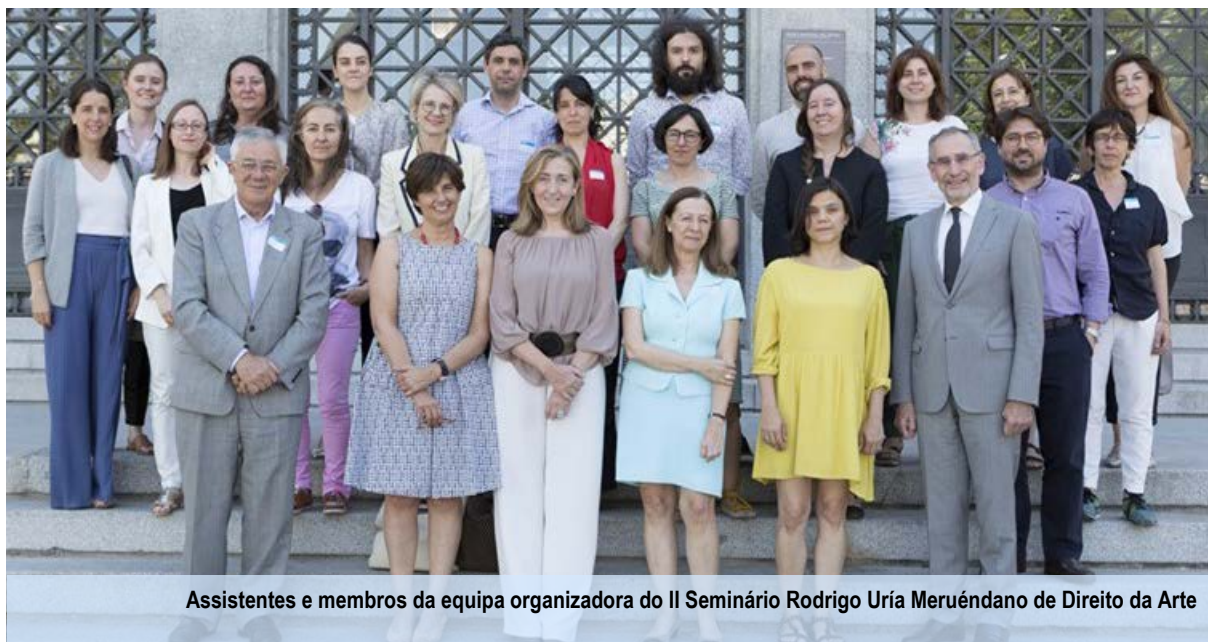
Assistentes e membros da equipa organizadora do II Seminário Rodrigo Uría Meruéndano de Direito da Arte