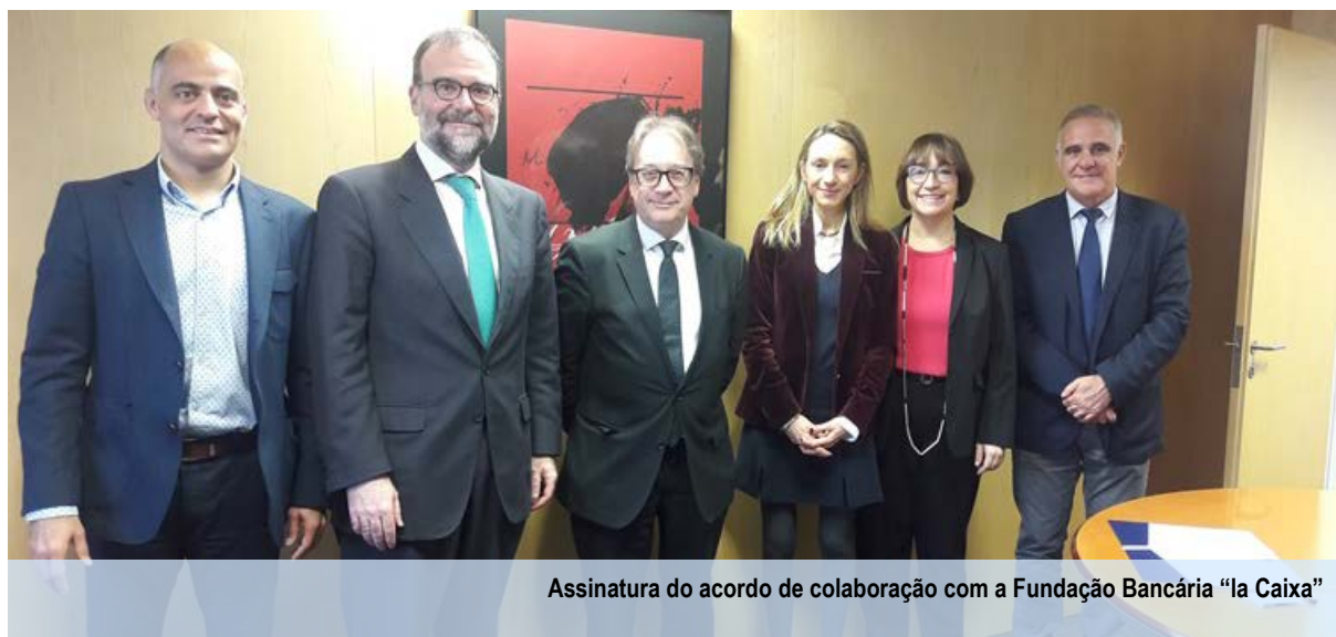
Assinatura do acordo de colaboração com a Fundação Bancária “la Caixa”