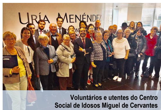
Voluntários e utentes do Centro Social de Idosos Miguel de Cervantes

Durante o ano de 2018, participaram neste programa 9 voluntários que fizeram visitas periódicas ao centro e organizaram encontros com os utentes no escritório da Uría Menéndez de Londres.