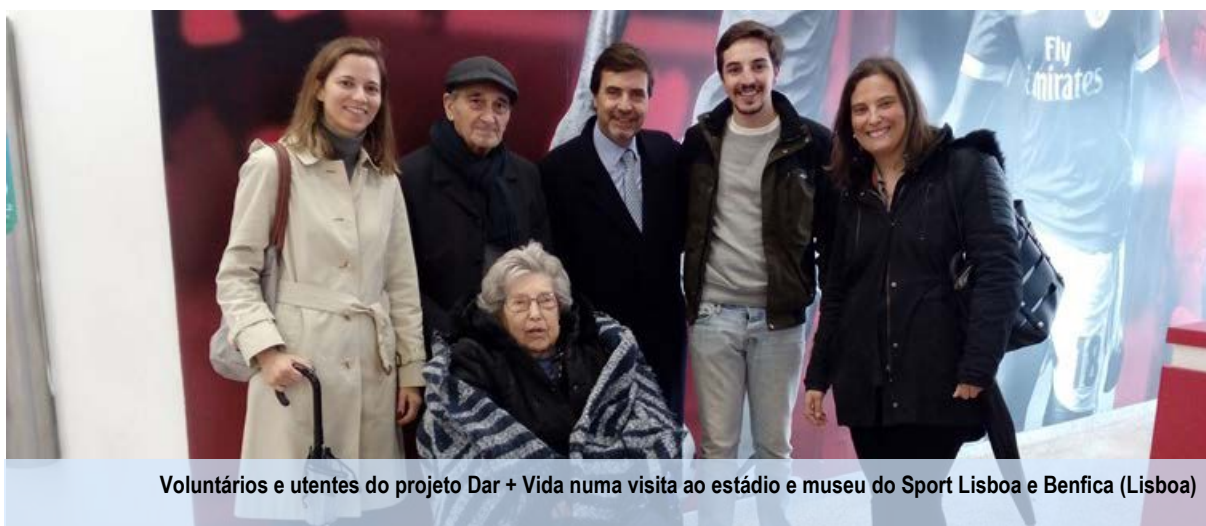
Voluntários e utentes do projeto Dar + Vida numa visita ao estádio e museu do Sport Lisboa e Benfica (Lisboa)

No ano de 2018 participaram neste programa 38 voluntários .