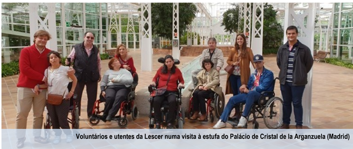
Voluntários e utentes da Lescer numa visita à estufa do Palácio de Cristal de la Arganzuela (Madrid)