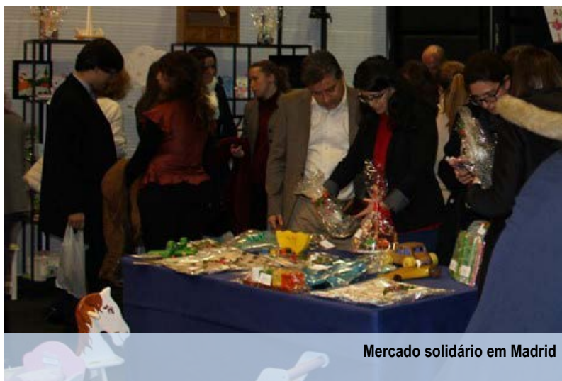
Mercado solidário em Madrid

Por outro lado, durante o ano de 2018, a Fundação Professor Uría continuou com as campanhas solidárias iniciadas em anos anteriores, tais como a recolha de roupa e livros, e os pequenos-almoços solidários. Todas as campanhas foram realizadas para benefício de diferentes instituições sociais.