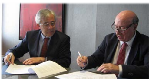
Firma del convenio con Fundación Santa María la Real-Centro de Estudios del Románico (22 de mayo).