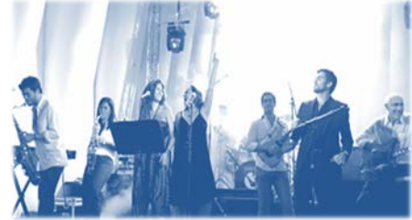
Grupo “Heróis del Despacho”, banda de Uría Menéndez - Proença de Carvalho.

La quinta edición de Rock'n'Law, celebrada el 27 de junio, consiguió recaudar 56.800 € y volvió a ser una gran fiesta de la música y de la solidaridad. El evento reunió a 1.800 personas en el restaurante KAIS de Lisboa que disfrutaron de la actuación en directo de las nueve bandas participantes, todas ellas formadas por componentes de firmas de abogados portuguesas, entre las que figura Uría Menéndez - Proença de Carvalho.