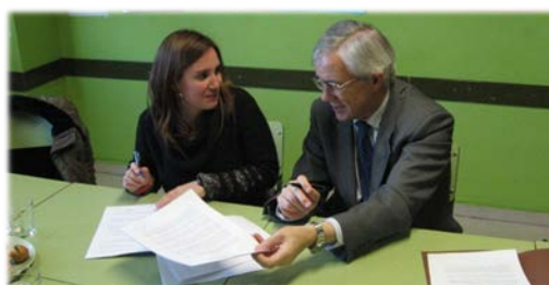
Firma del convenio con Aventura 2000 (6 de marzo).