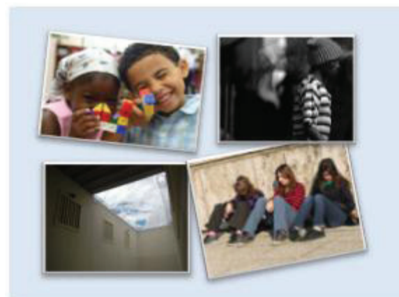
Los cuatro colectivos a los que se dirige prioritariamente el pro bono son infancia, juventud, inmigrantes y reclusos.

En este sentido, hemos colaborado activamente, junto con la Fundación Alicia Koplowitz y otras entidades no lucrativas en encuentros de destacados profesionales de los diferentes sectores que intervienen en el día a día de la infancia y la adolescencia, para reflexionar sobre la realidad cotidiana y desde la actividad especializada, con el fin de contribuir a mejorar los mecanismos de protección jurídica del menor.