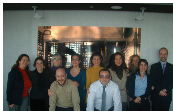
Algunos de los voluntarios que han participado en el proyecto

Durante los meses de noviembre y diciembre de 2011 hemos recibido a dos alumnas del IES Tetuán de las Victorias de Madrid. De la mano de nuestros voluntarios han podido conocer de cerca la realidad del mundo laboral y diseñar un plan de acción que las ayude a conseguir su objetivo profesional.