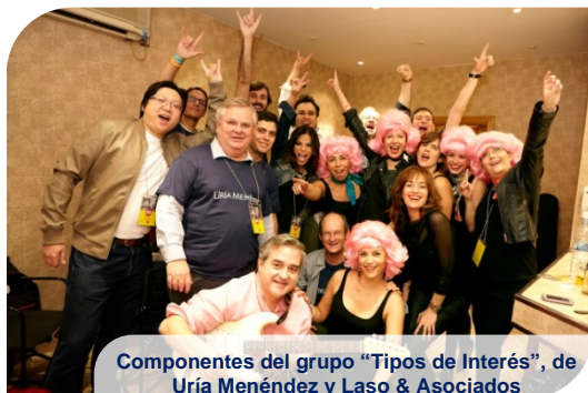
Componentes del grupo "Tipos de Interés", de Uría Menéndez y Laso & Asociados

Se recaudaron 74.691 € que fueron destinados a Re-Food , entidad que recoge comida en buenas condiciones en restaurantes, cafeterías y supermercados para distribuirla entre personas necesitadas.