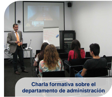
Charla formativa sobre el departamento de administración

La Fundación Profesor Uría ha participado por cuarto año consecutivo en esta iniciativa acogiendo a cuatro estudiantes de los institutos de educación secundaria San Isidro, Palomeras-Vallecas y Calderón de la Barca. A lo largo de los tres días que ha durado su estancia educativa, los alumnos han conocido de la mano de los 23 voluntarios que han participado en el programa los diferentes departamentos que componen un despacho de abogados, con lo que se les ha proporcionado una experiencia formativa y educativa próxima al mundo laboral y empresarial.