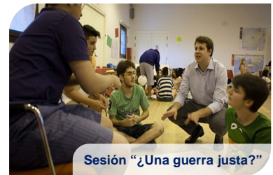
Sesión “¿Una guerra justa?”

La Fundación Profesor Uría ha colaborado becando la participación de 6 jóvenes e impartiendo una sesión titulada “¿Una guerra justa?” dentro de las actividades programadas durante el campamento.