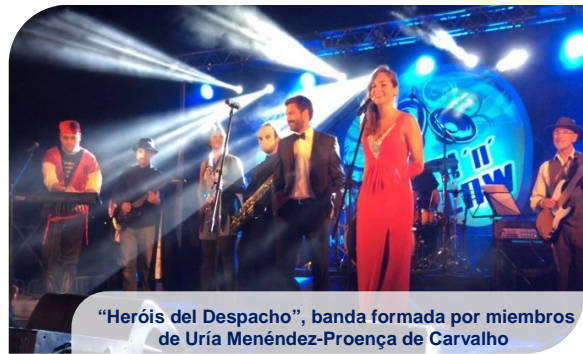
"Heróis del Despacho", banda formada por miembros de Uría Menéndez-Proença de Carvalho